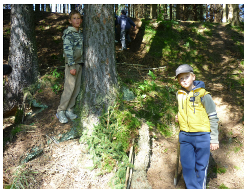
Domečky pro zvířátka

Autorem materiálu a všech jeho částí, není-li uvedeno jinak, Mgr. Renata Kozlerová