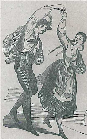
■ Dobová karikatura tanečnicků polky

nad Labem, vystřídala několik služeb. Po byt v malém středočeském městečku rázné a živelné dívky prospíval. Ukázalo se, že před její veselou povahou není úniku. Hlasitý a procítěný zpěv se při každodenním úklidu rozléhal celým domem. Jediný volný den v týdnu ráda trávila po zábavách. Právě zde ji jednou večer vyzvali, aby něco zazpívala a zatančila. Svérázné mladé ženě to zalichotilo. A tak společnost překvapila neobvyklým poskakováním, kterým doprovázela píseň Strejček Nimra koupil šimla . Houpavé a skákavé kroky přivedly přihlížeující v úžas a posléze v nadšení. Bylo to jednoduché a pěkné na pohled. Bezprostřední Anna strhla svým trdlováním i ostatní. Obyvate-